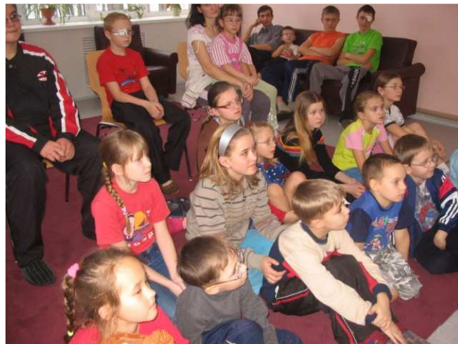
Kinderen luisteren met aandacht in een ziekenhuis voor oogbehandeling.