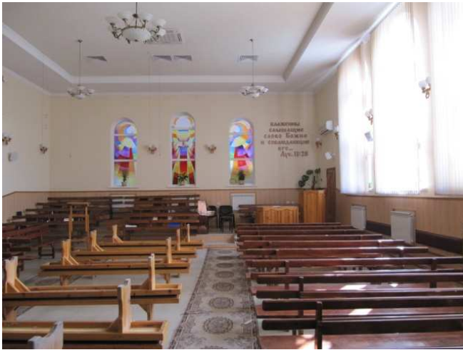
Kerkzaal: Rostov a.d. Don

De Bijbels, lectuur en kleding worden dankbaar in ontvangst genomen. Men kan het heel goed gebruiken en we mogen de HEERE daarvoor danken. De pastor bedankt de Urker kerken en bevolking voor de steun, hij vindt het heel bijzonder dat een klein land als Nederland, en een klein dorp als Urk omziet naar de broeders en zusters in het grote Rusland. Een wonder van genade, geschonken door de HEERE.