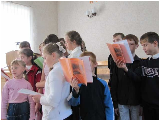
Kinderkoor: Kerk Poltava

Op het terrein van de kerk, is ruimte om de bussen te parkeren. De Bijbels, lectuur en kleding worden dankbaar in ontvangst genomen. Er wordt veel geëvangeliëerd onder alcohol en drugs verslaafden. Men is dankbaar voor de vele gaven, die ze van harte inzetten voor het evangelisatie werk.