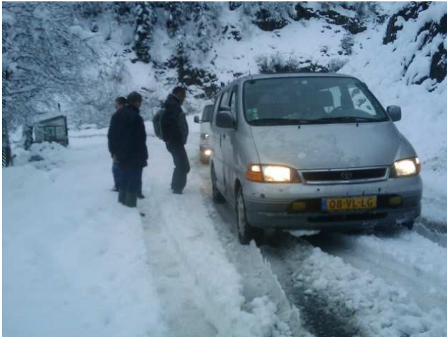
Bijbeltransport november 2009 Georgië

De Urker stichting "Hulp aan Verdrukte en Vervolgde Christenen" is sinds de jaren '70 betrokken bij Bijbeltransporten naar de voormalige Oostbloklanden. Ook in 2010 werden met Gods hulp en onder 's Heeren Zegen weer transporten uitgevoerd. Ook via postverzending werd 1500 kilo aan Bijbels en Bijbelverklaringen verzonden. In deze folder geven wij een uitgebreid verslag van één van de gemaakte reizen en de postverzending.